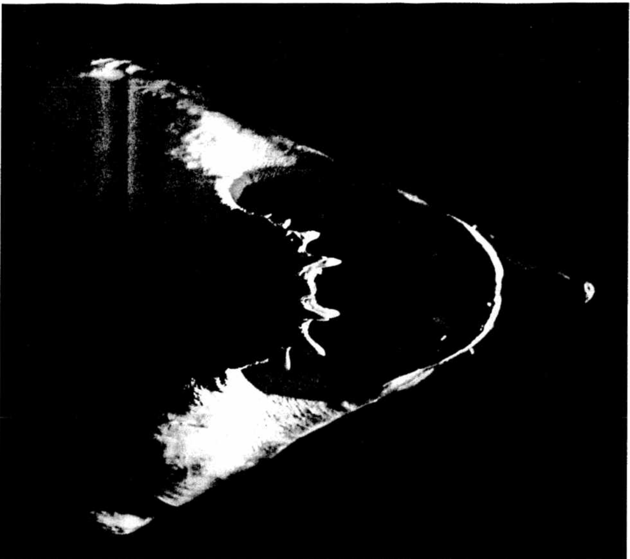
Niet zo vreemd om zo'n grote vis te zien als zeemonster.

om grote zeedieren, vermoedelijk ook om de walvis die in die tijd nog in de Middellandse Zee leefde. Wat Genesis 1 hier zegt is dat zelfs die grote zeedieren net zulke gewone schepsels zijn als de wormen en schelpdieren die ook in zee leven.