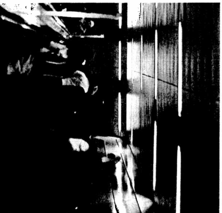
Verder rennen naar je volgende afspraak.

Caroline Tax is lid van het dagelijks bestuur van het CDA.